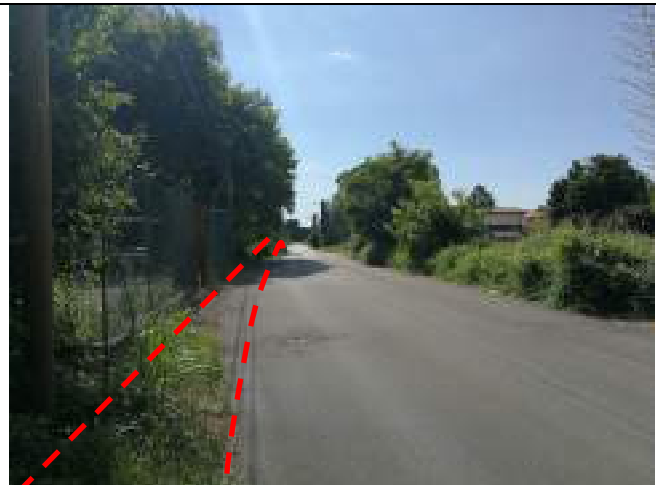
Via Diaz in prossimità impianto sollevamento