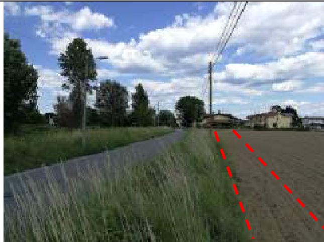
Via Diaz ubicazione percorso su area agricola