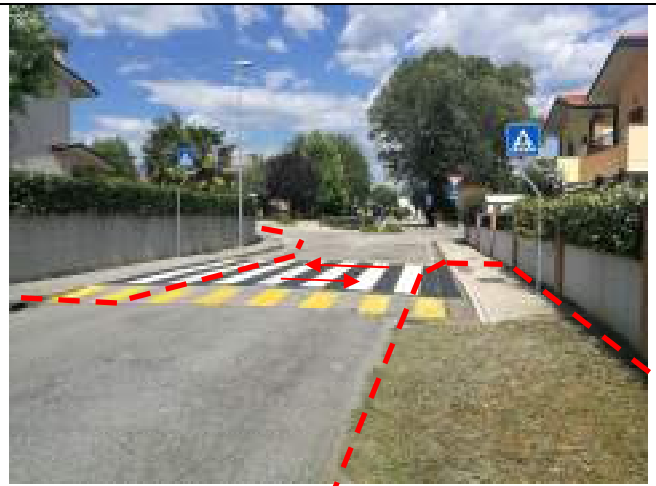
Via Diaz passaggio pedonale in prossimità rotatoria