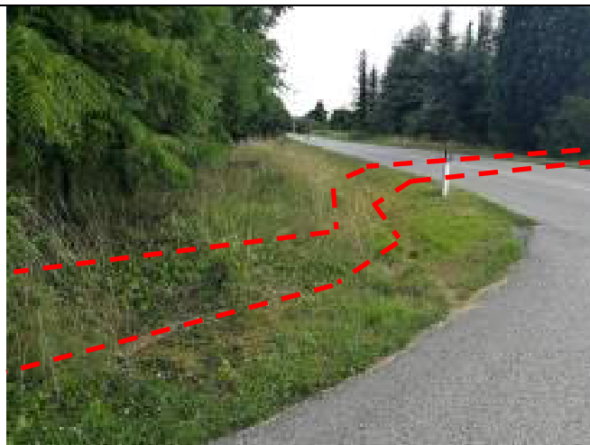
Incrocio con SP1