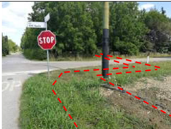
Via Diaz oltre SP1