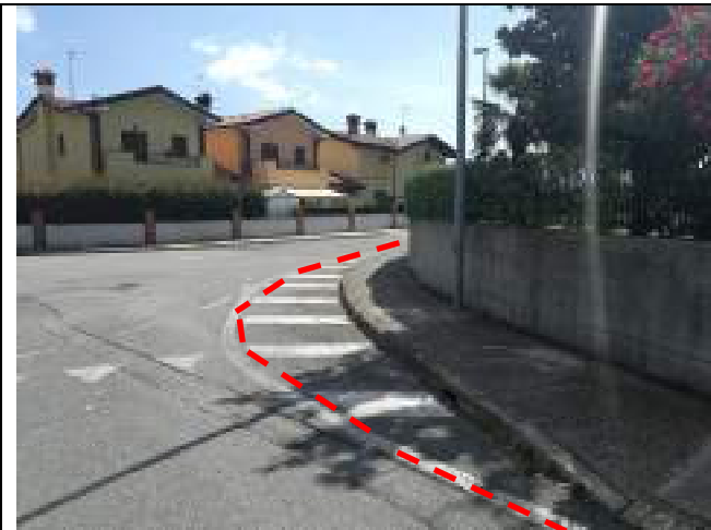
Incrocio con via Trieste