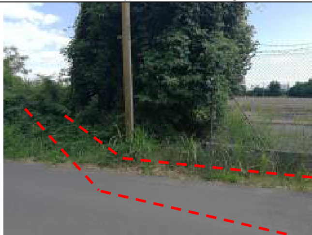
Via Diaz in prossimità impianto sollevamento